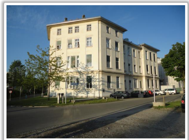
Zytologisches Institut Graz, Auenbruggerplatz 20